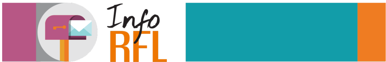
Le bulletin régional en condition féminine