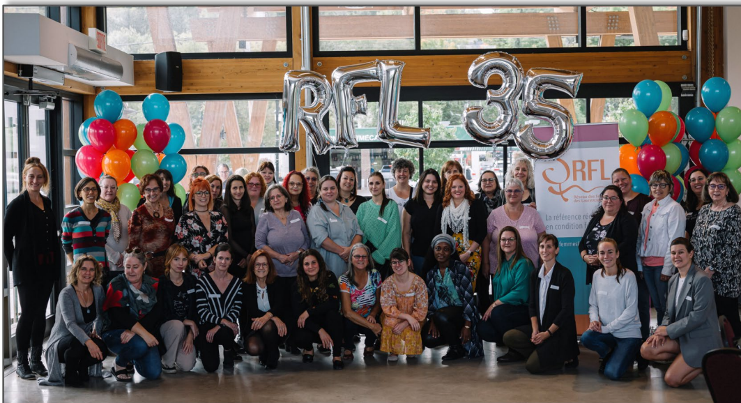
Les membres du RFL réunies à Sainte-Adèle le 22 septembre 2022.

Exceptionnellement, l'AGA a eu lieu au début de l'automne, le 22 septembre 2022. Le RFL a profité de ce grand rassemblement annuel pour célébrer ses trente-cinq ans d'existence. Cinquante représentantes des groupes-membres, ainsi qu'une vingtaine de personnes et d'organisations alliées ont participé à l'événement. Le quiz élaboré pour l'occasion a suscité intérêt et curiosité. Les questions portant sur les violences envers les femmes, l'autonomie économique, la santé et la place des femmes dans les lieux décisionnels n'a laissé personne indifférent. La journée s'est terminée avec un cocktail-réseautage qui a permis la rencontre entre les membres, partenaires et allié.e.s.